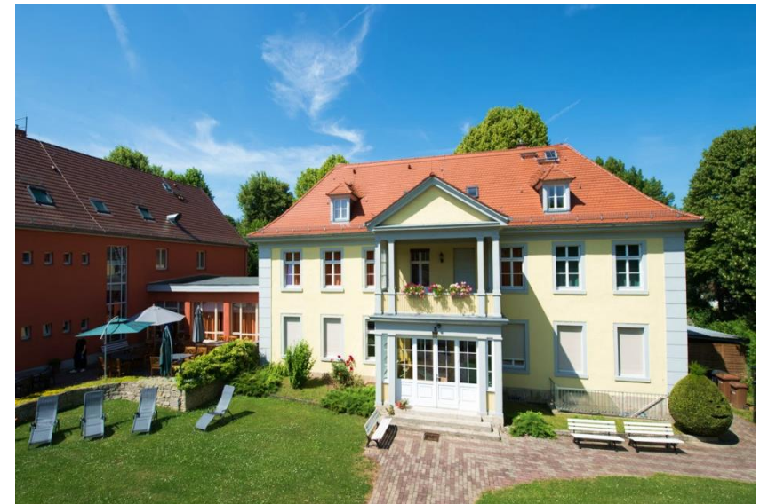
Das Konrad-Martin-Haus in Bad Kösen